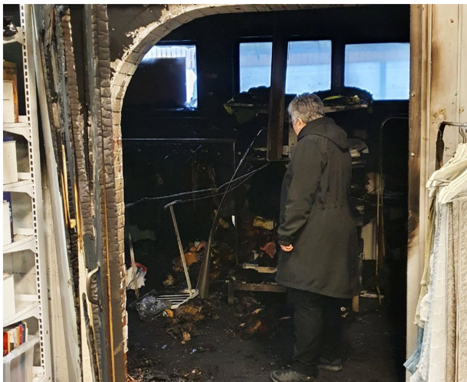
Store skader etter brannen i lokalene i Hillevåg.

Det er jo kanskje litt trist å starte året med å sette fokus på slik hendelser, men det blir en alvorlig påminnelse til oss alle, at BRANN kan forekomme også i våre butikker. Derfor er det viktig med HMS arbeid og brannforebyggende tiltak, sikre frie rømningsveier og at brann og varslingsutstyr er i orden.