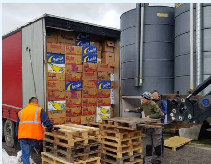
Lasting av nips.

Kristiansand fører an og øker antall utplasserte bokser. Fra 30 bokser jobber de mot 40 bokser. Alle monner drar og vi er derfor glade for å sende en ekstra boks til Fagernes og Mandal. Snart er vi klar for å sette ut bokser i Fredrikstad og Sarpsborg, og det er mange gode krefter for å øke antall plasser der vi allerede er tilstede. For Klepp, Sandnes og Stavanger vil det skje mer utover høsten. Ønsker du boks(er) utenfor din butikk, eller i nærområdet, for mer klær til butikken, ta kontakt på budneseter@nlmmiljo.no