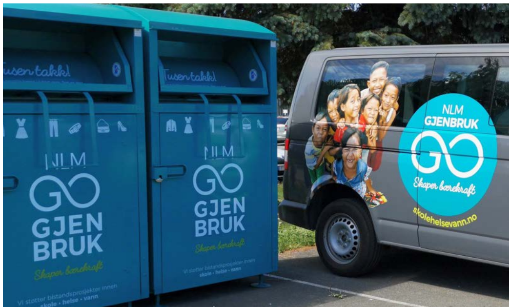
«Skaper bærekraft» står på boksene og f.eks på revidert profilering på bilene.

GJENBRUK OG MILJØ under fanen VERDEN FOR KRISTUS